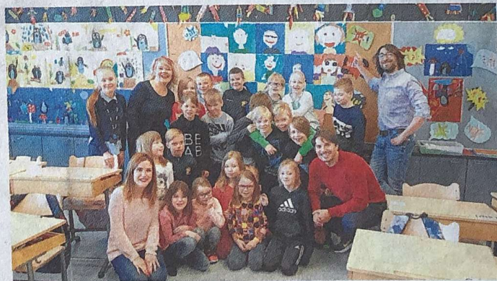
Alumnos y profesores participantes en el proyecto

En cualquier caso, el plato fuerte de esta cooperación educativa ha sido tanto la formación docente e intercambio de experiencias educativas, realizada en Inglaterra en noviembre de 2018; como las movilidades, teniendo lugar la primera en nuestro país en enero de 2019, la segunda en la ciudad finlandesa de Pirkkala, en abril de 2019 y la tercera en Hranice, en República Checa, en noviembre de 2020. La última movilidad debería haber sido en mayo de 2020 en Escomb, Inglaterra,